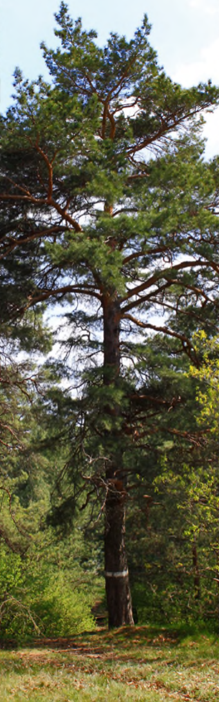
PINUS CRETACEA KALENICZ. EX LYPA – СОСНА МЕЛОВАЯ