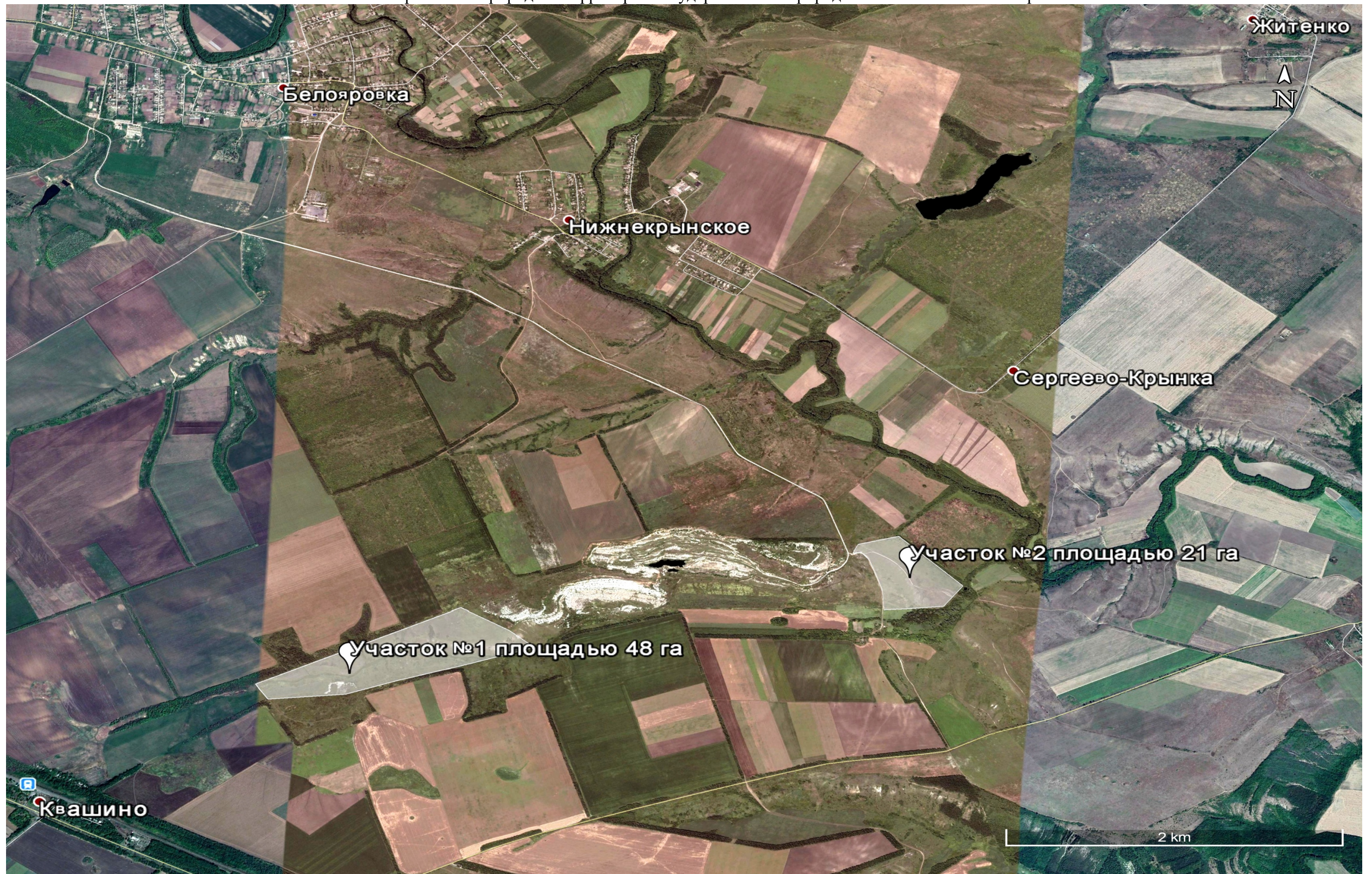
Схема особо охраняемой природной территории государственный природный заказник «Балка Широкая»